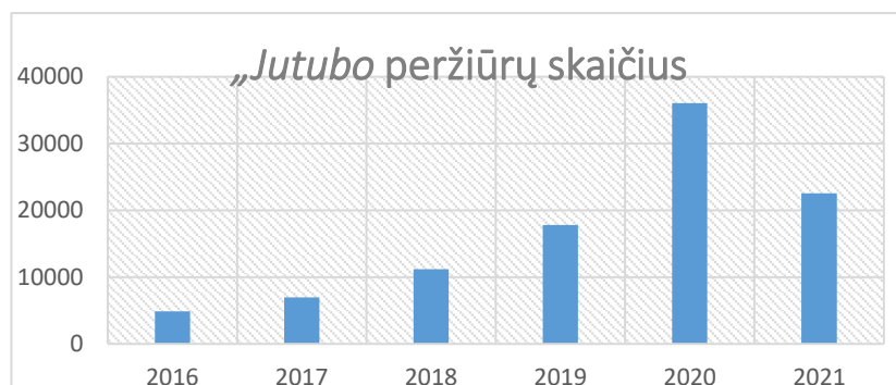
12 pav. Savivaldybės paskyros jutube peržiūrų skaičius

2019–2021 metais vykdant posėdžių transliaciją atlikta analizė pagal peržiūroms naudojamų įrenginių tipą rodo, kaip kinta ir kaip pasiskirsto vartotojų poreikiai.