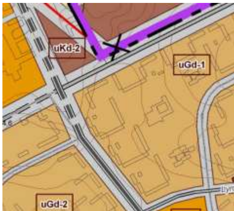
Ištrauka iš bendrojo plano

Koreguojami nepagrindiniai detaliojo plano sprendiniai neprieštarauja Šiaulių miesto bendrajam planui. Šiaulių rajono bendrajame plane teritorijai, kurioje yra planuojamas sklypas nustatyta funkcinė zona - struktūrinių gyvenamųjų vietovių (uGd-1) – gyvenamosios didelio užstatymo intensyvumo teritorijos, mišri teritorija, kurioje prioritetas teikiamas dominuojančiai gyvenamajai (daugiaaukščiai) funkcijai. Teritorijos planinė ir erdvinė struktūra beveik susiformavusi, jose yra viešųjų erdvių sistema. Vykdomas urbanizuotų teritorijų fizinės ir (ar) funkcinės struktūros atnaujinimas, išnaudojami vidiniai teritorijų resursai, baigiamos formuoti urbanistinės struktūros.