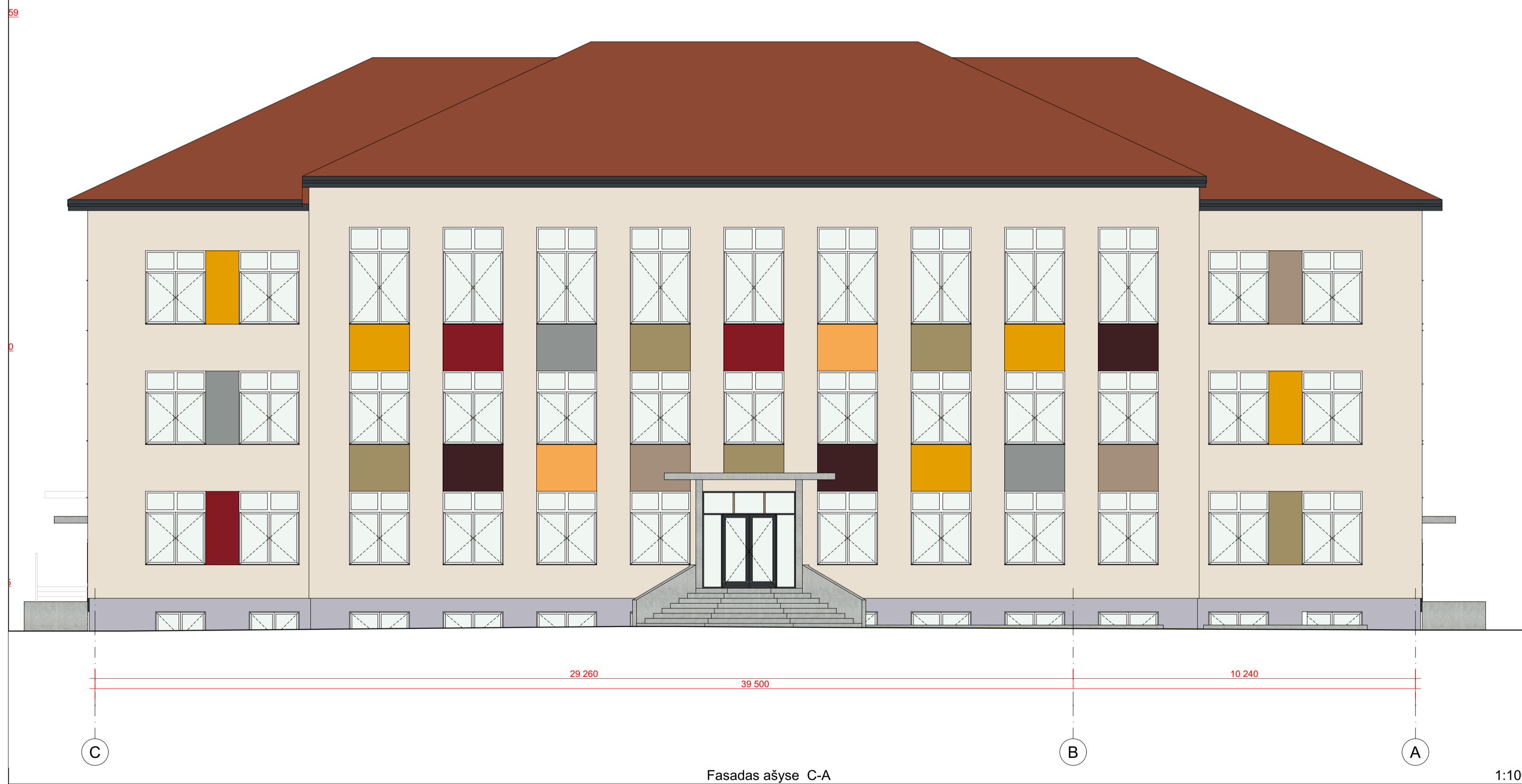
Fasadas ašyse C-A