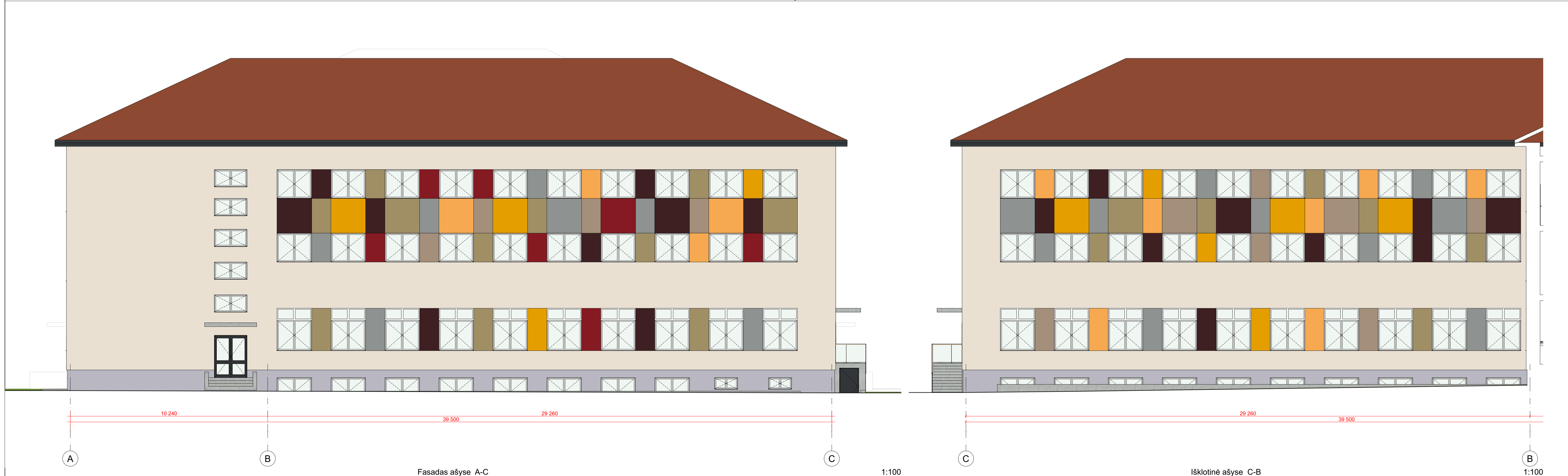
Fasadas ašyse A-C