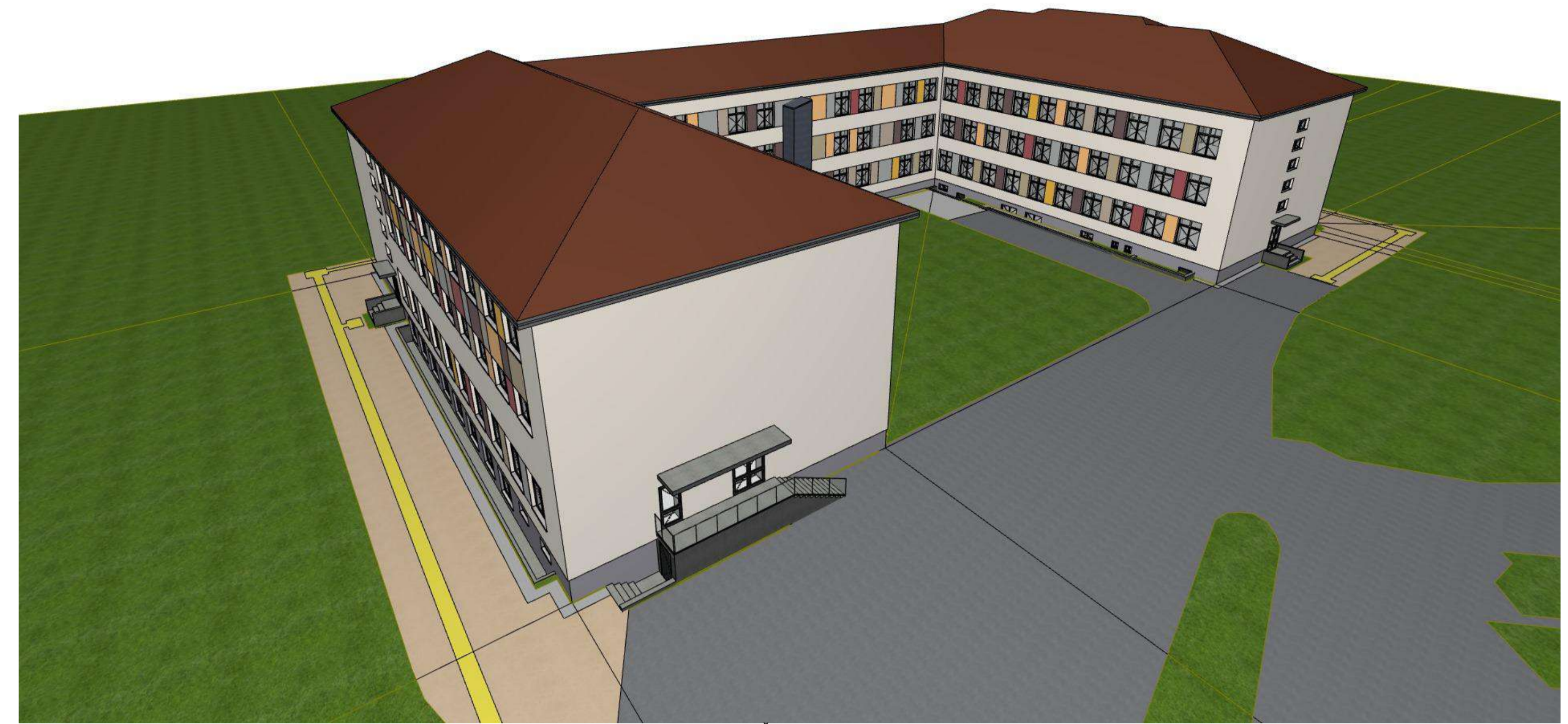
Vaizdas iš Šiaurės rytų pusės