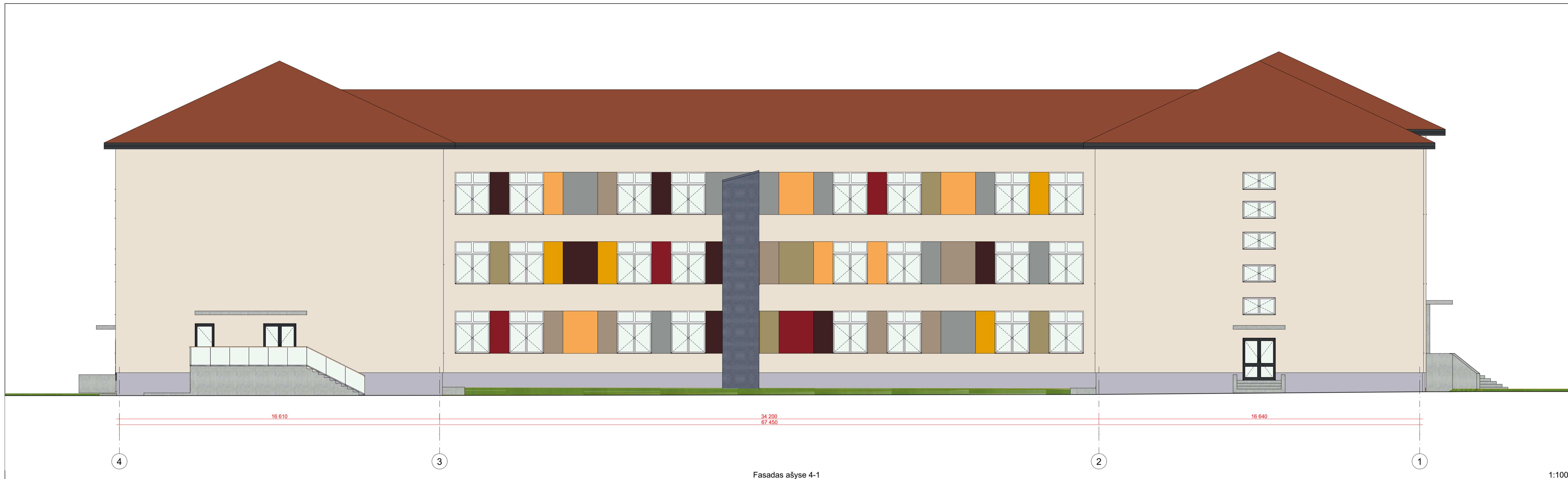
Fasadas ašyse 4-1