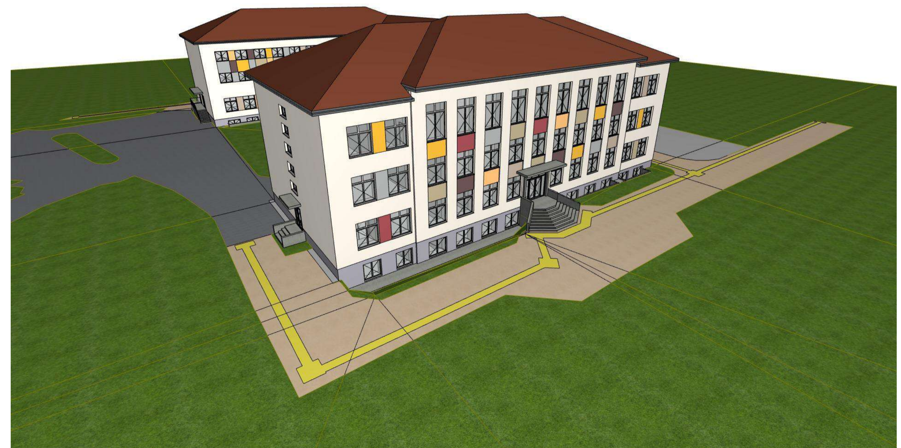
Vaizdas iš Šiaurės Vakarų pusės