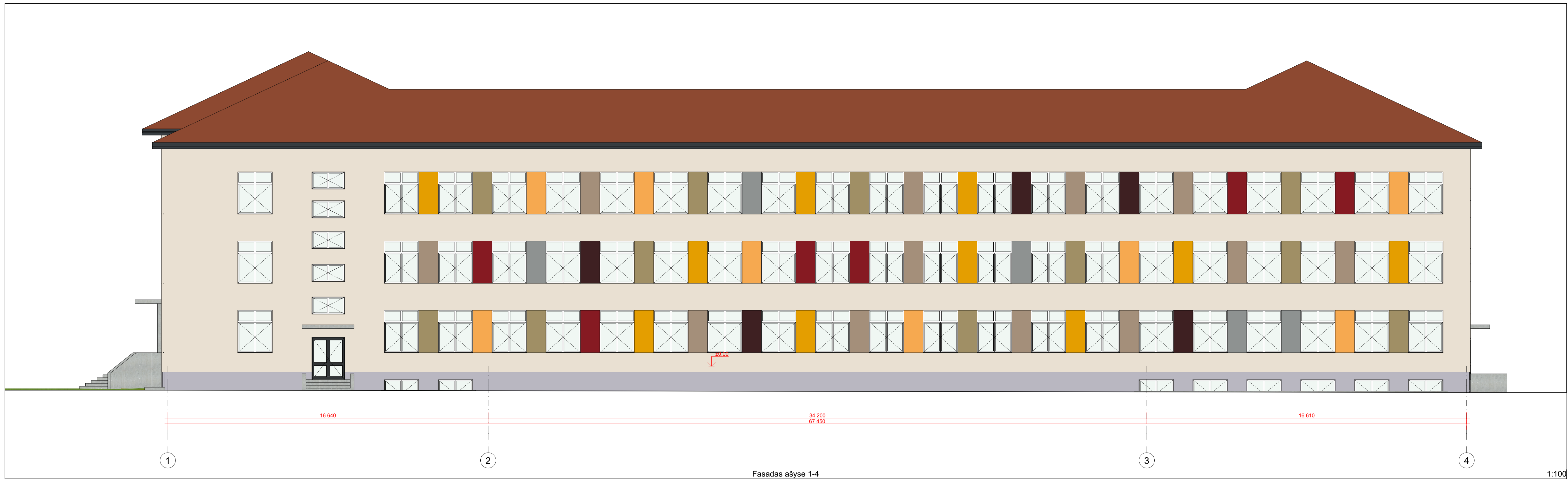
Fasadas ašyse 1-4