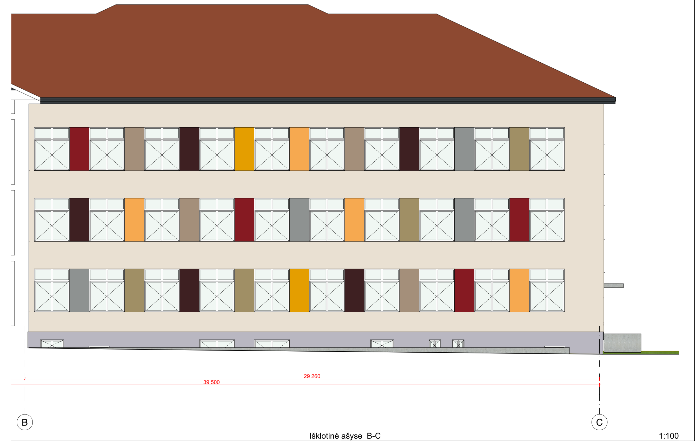
Išsklotinė ašyse B-C