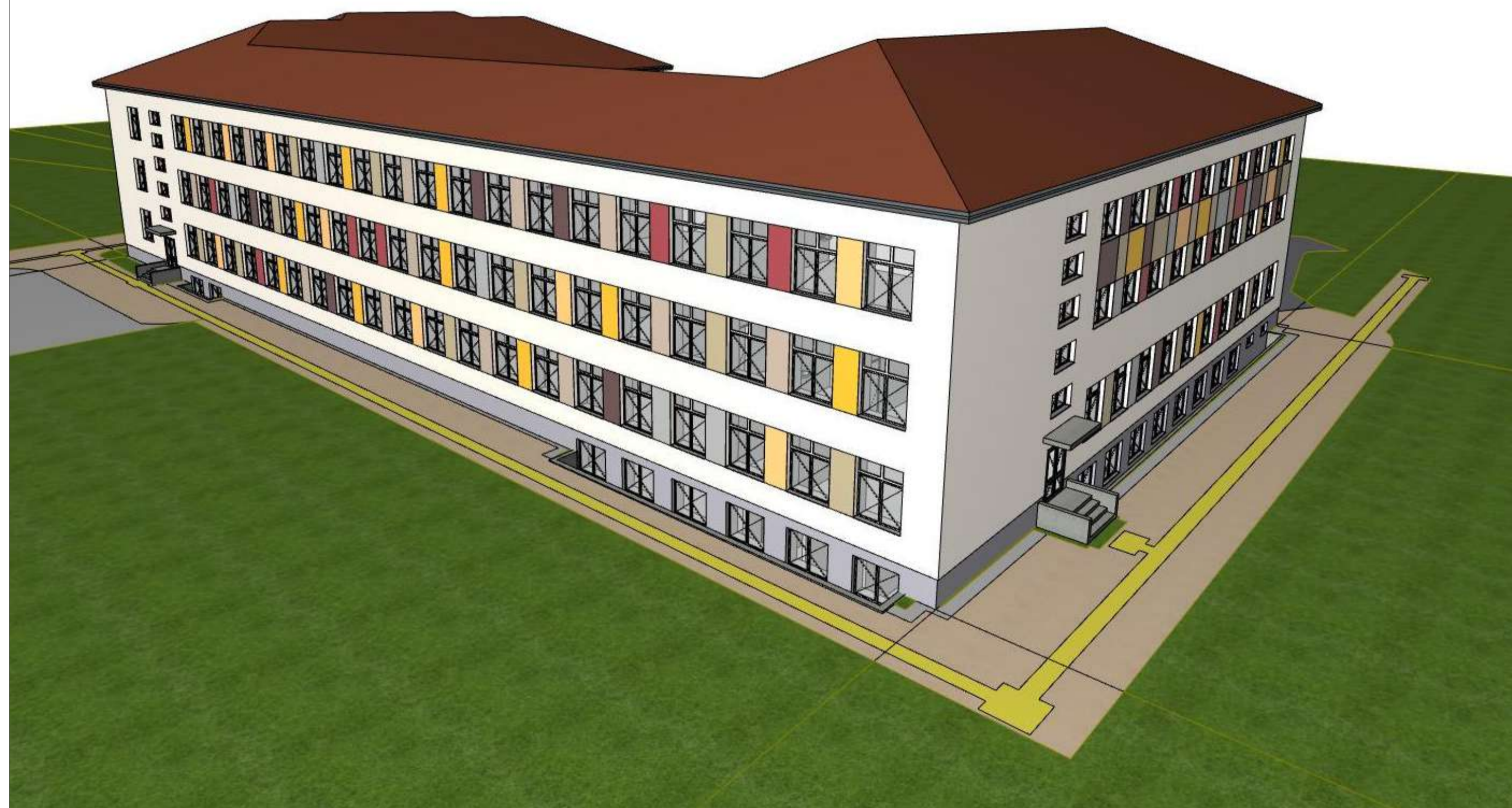
Vaizdas iš Rytų pusės