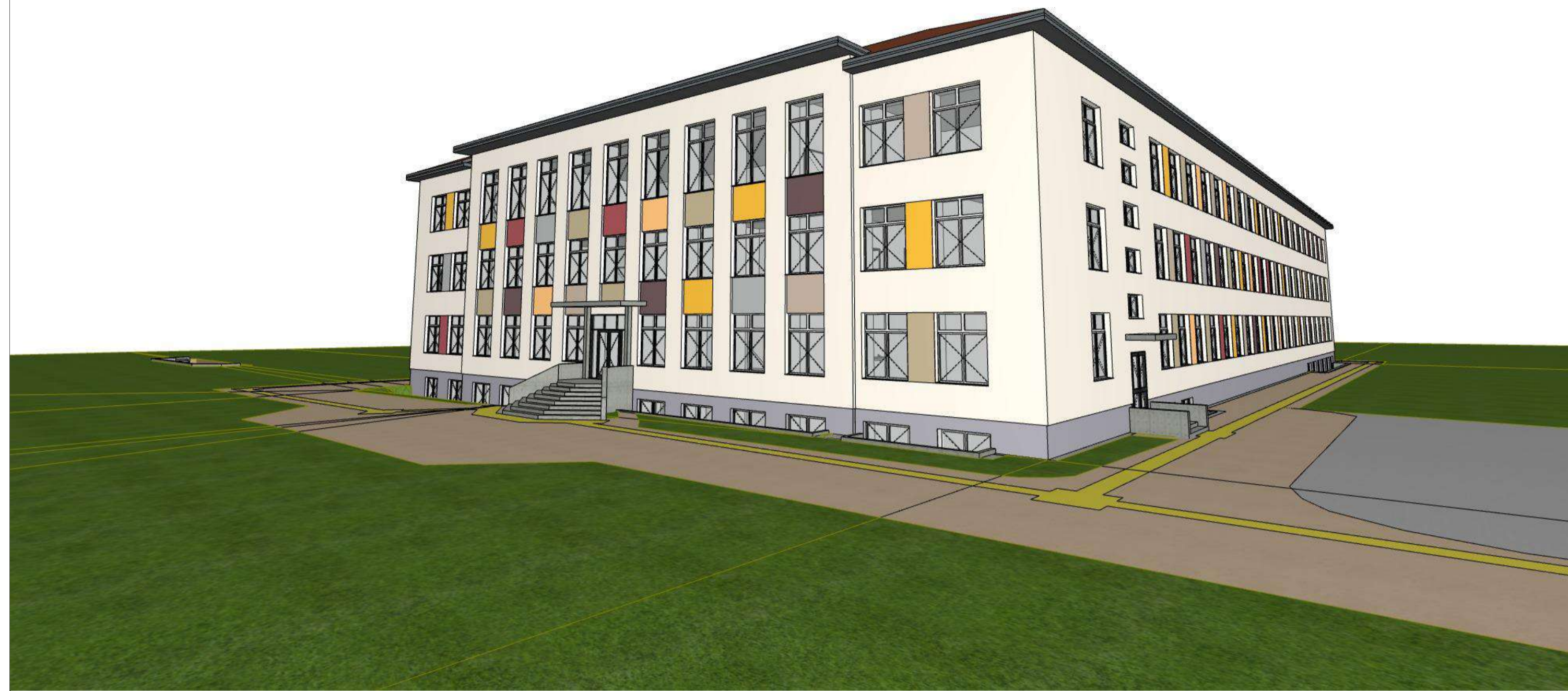
Vaizdas iš Vakarų pusės