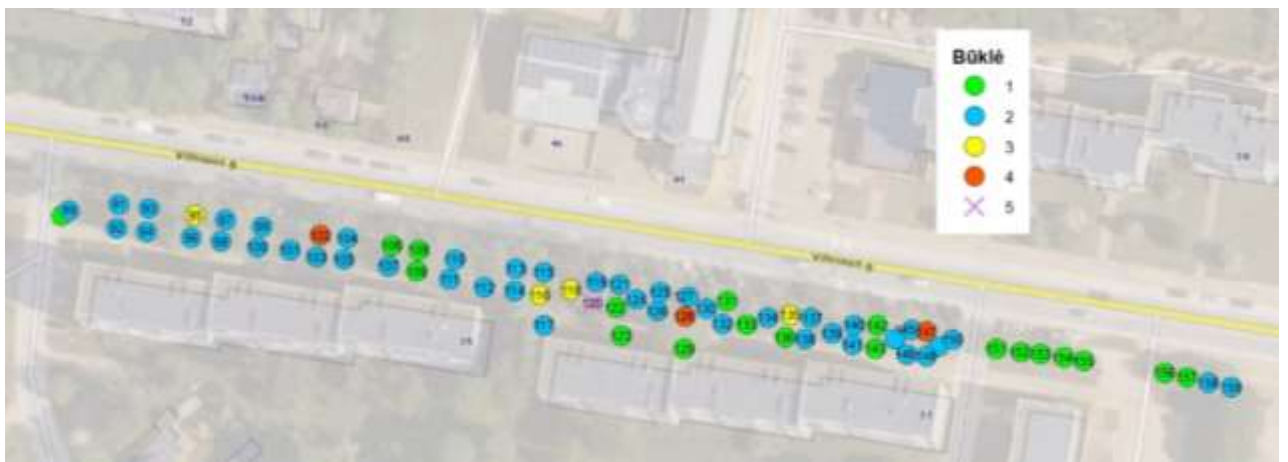
Medžių Nr. 89-159 išsidėstymas pagal būklę