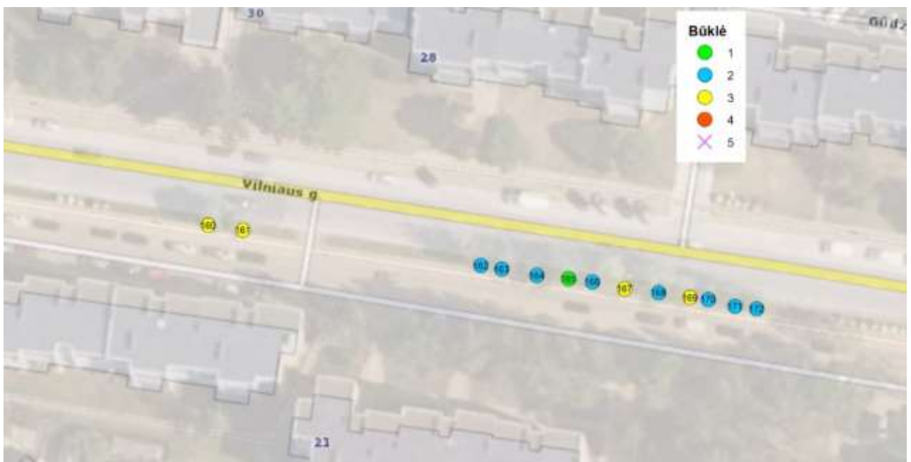
Medžių Nr. 160-172 išsidėstymas pagal būklę