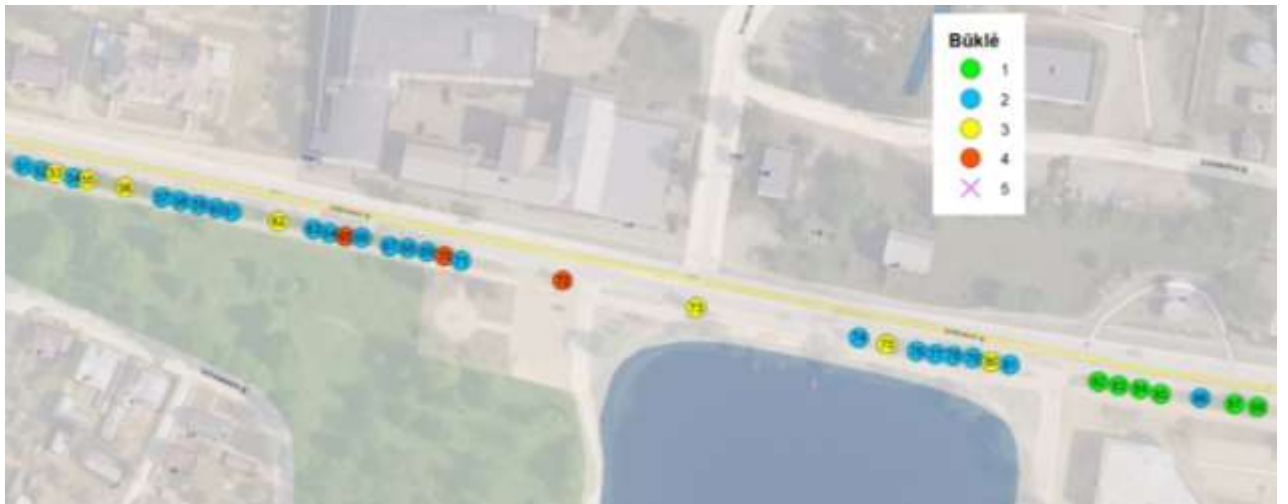
Medžių Nr. 52-88 išsidėstymas pagal būklę