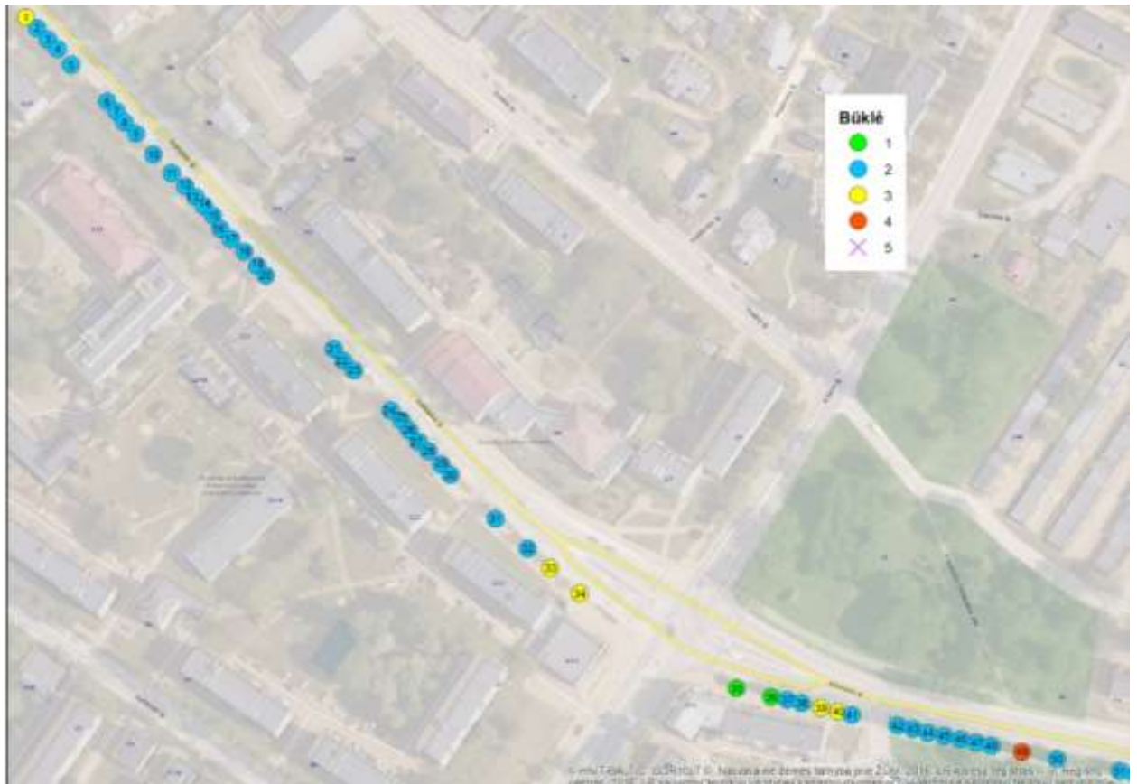
Medžių Nr. 1-51 išsidėstymas pagal būklę