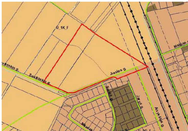
Ištrauka iš Šiaulių rajono bendrojo plano keitimo