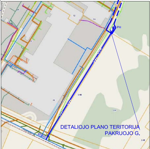
VANDENTIEKIO PRIVEDIMAS IŠ PAKRUOJO GATVĖS PROJEKTUOJAMAM HIDRANTUI SCHEMA 1